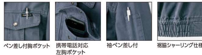
ペン差し付胸ポケット