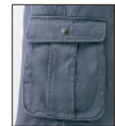
マチ付カーゴポケット