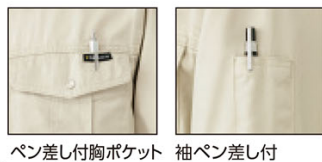
ペン差し付胸ポケット