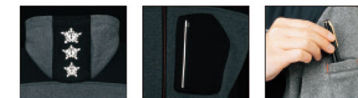
後フードに再発反射プリント