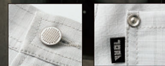
カジュアル感のある ドットボタン