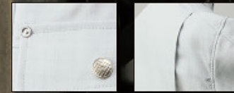
カジュアル感のある ドットボタン・リベット