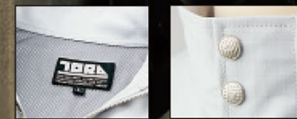
背裏メッシュ仕様