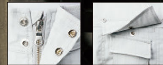
ダブルメタルボタン、 ファスナー仕様