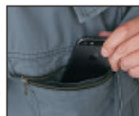
右胸携帯電話 収納ポケット