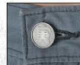
黄帯オリジナルボタン