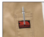
左袖ブランドネーム付 ペン差し