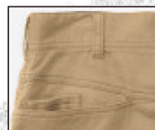
左後二重ポケット