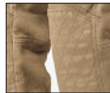
膝補強ステッチ仕様