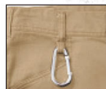
右前カラビナループ仕様