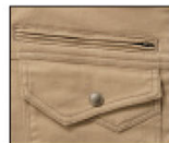
右胸ファスナーポケット