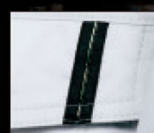
ワンポイントテープ