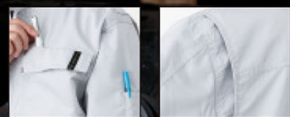
左胸、袖ベン差し付