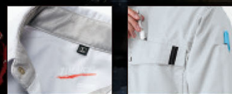
衿裏メッシュ仕様