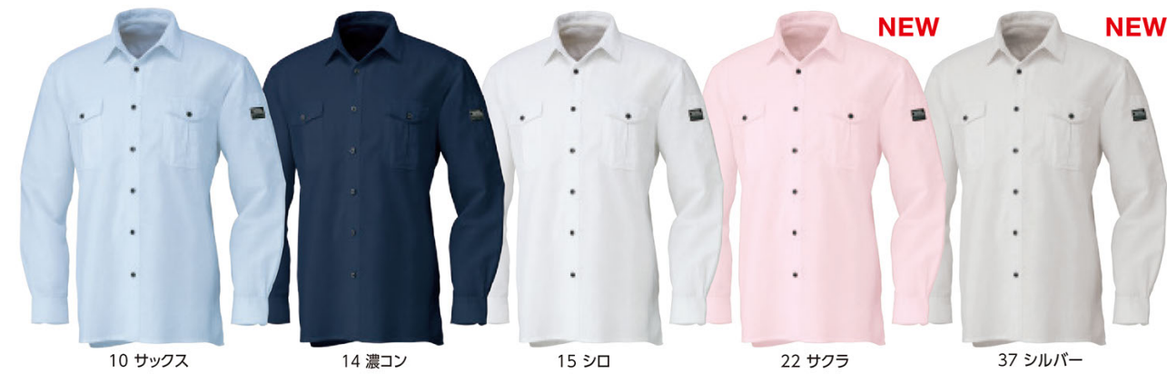
10 サックス 14 濃コン 15 シロ 22 サクラ NEW 37 シルバー NEW