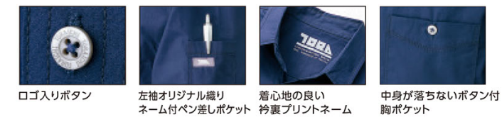
ロゴ入りボタン 左袖オリジナル織りネーム付ベン差しポケット 着心地の良い衿裏プリントネーム 中身が落ちないボタン付胸ポケット