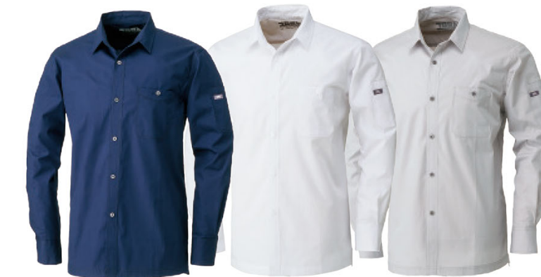
14 濃コン 15 シロ 37 シルバー