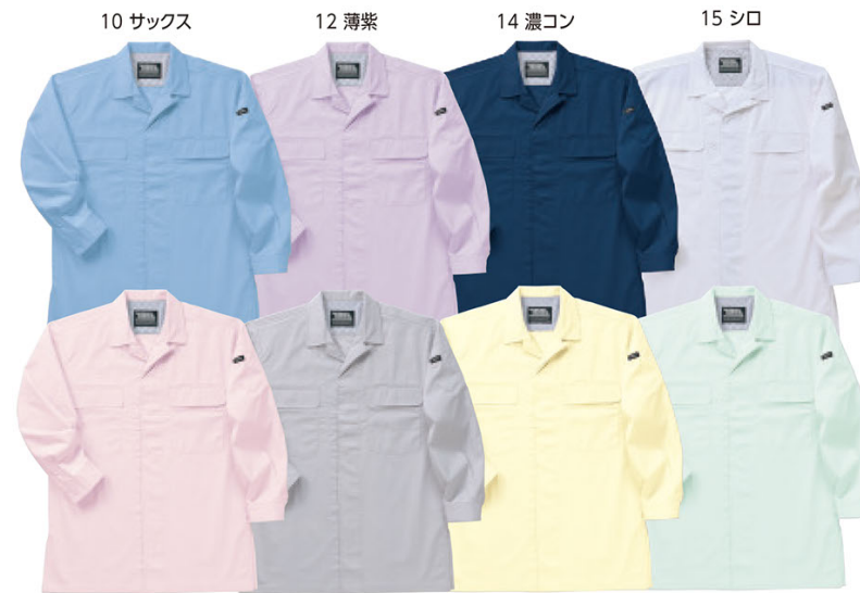
10 サックス 12 薄紫 14 濃コン 15 シロ 22 桜色 37 シルバー 43 薄黄 55 薄緑