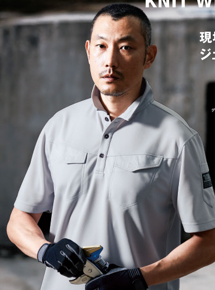
ディンプルメッシュ