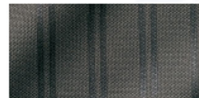
光沢、高級感のある プリスター素材