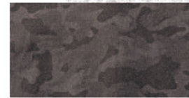
虎柄入り迷彩プリント