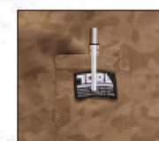
左袖ブランドネーム付 ペン差し