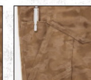
左足脇にパッチポケット